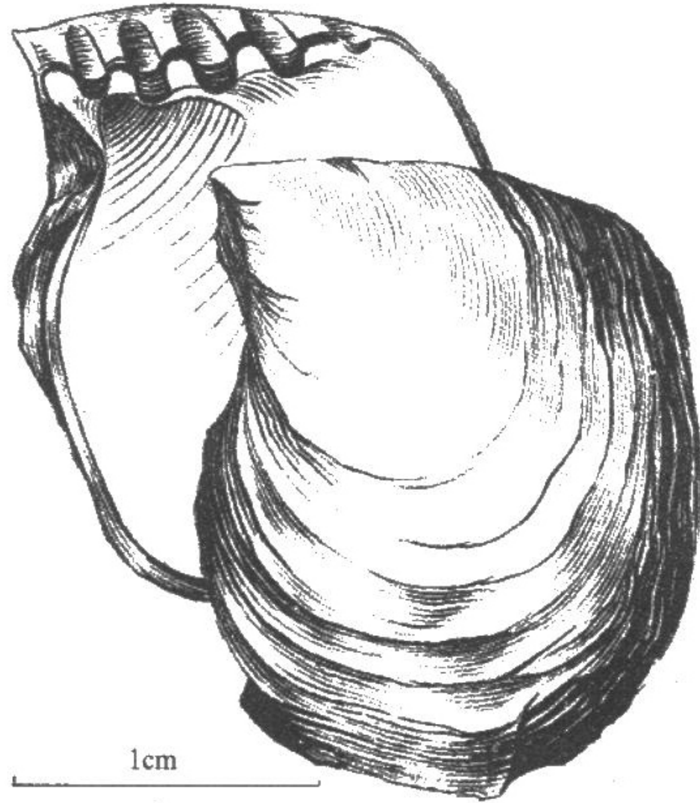
图 62 方形钳蛤 Isognomon nucleus (Lamarck)